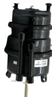
05840530 BOMBA TRAVÃO DE DISCO 16"/24" LT TIPO SAF C/ RACARODES