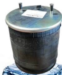
05840220 PNEUMÁTICO COMPLETO 22619V LT