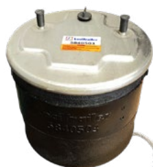
05840503 PNEUMÁTICO COMPLETO MODELO 30K PERNO CENTRAL LT

APROVEITE AS MELHORES OFERTAS EM PEÇAS DE SUBSTITUIÇÃO PARA O SEU FRIGORÍFICO