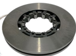
05840060 DISCO TRAVÃO INTEGRAL ADAP. SAF LT