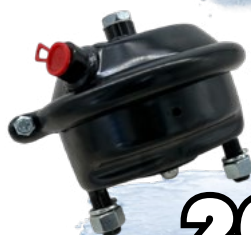
05840153 BOMBA TRAVÃO DE DISCO 16" LT