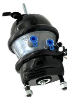
05840157 BOMBA TRAVÃO DE DISCO 16"/24" LT