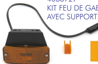
4083727 KIT FEU DE GABARIT ORANGE AVEC SUPPORT