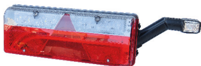
4083331 FEU ARRIÈRE DROIT EURO III AVEC CORNE SPIV