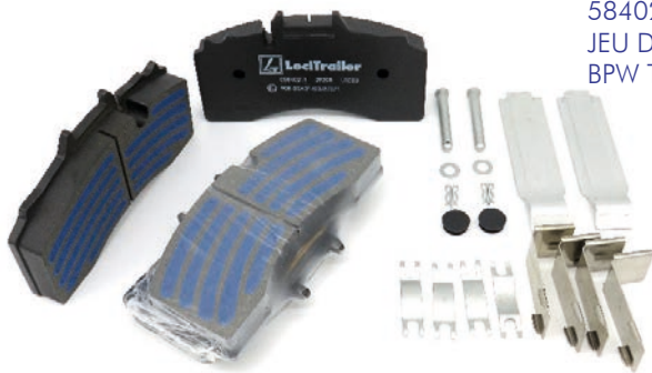
5840211 JEU DE PLAQUETTES DE FREINS LT BPW TSB 4309 WVA29228