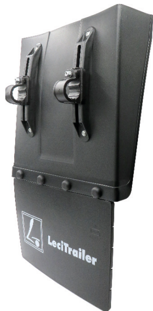
6522236 KIT SEMI-AILE LECITRAILER 460 X 760 AVEC BAVETTE *