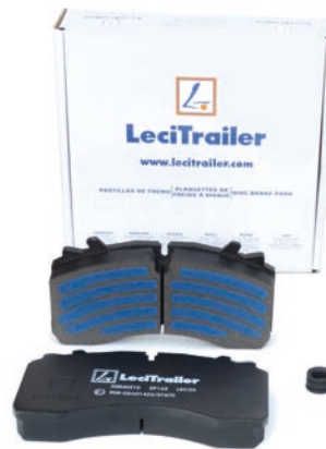
5840210 JEU DE PLAQUETTES DE FREINS LT VALX 4309 WVA29162