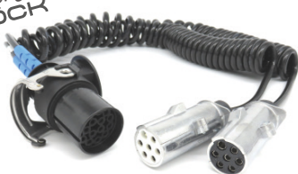
4010380 FLEXIBLES EXTENSIBLES 24 N-S A BASE 15 PINES