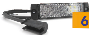
4031013 FEU DE GABARIT BLANC AVANT À LED