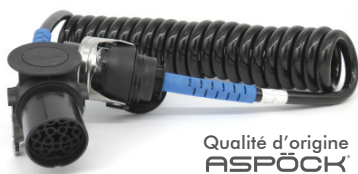
4010411 FLEXIBLES EXTENSIBLES ISO 12098 15 PINES