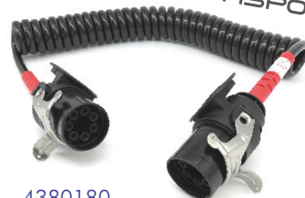
4380180 FLEXIBLES EXTENSIBLES "EBS" ISO 4091