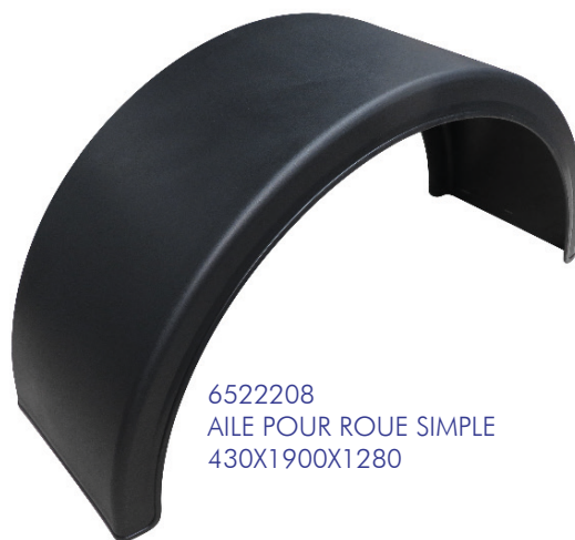
6522208 AILE POUR ROUE SIMPLE 430X1900X1280