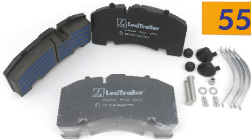
5840046 JEU DE PLAQUETTES DE FREINS LT SAF 4309 WVA29171