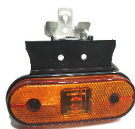
4083135 KIT FEU DE GABARIT ORANGE UNIPONT L0.5M AVEC SUPPORT