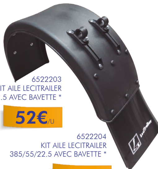
6522203 KIT AILE LECITRAILER 385/65/22.5 AVEC BAVETTE *