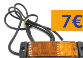
4083334 FEU DE GABARIT LATÉRAL ORANGE AVEC CATADIOPTRE