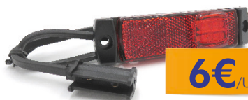
4031014 FEU DE GABARIT ROUGE ARRIÈRE À LED