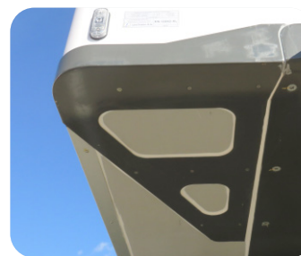
Opção reforço da cantoneira dianteira