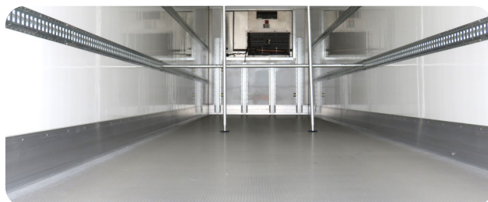
Piso de alumínio, rodapé de alumínio e guias de amarração de carga.