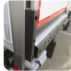
Batentes laterais verticais e batentes protegidos por chapa