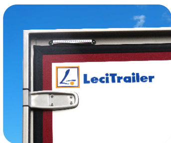
Quadro traseiro inox e luz sequencial de 3 posições