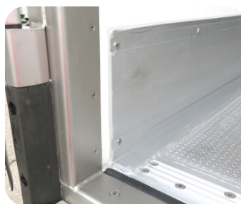
Borracha rotura ponte térmica e perfil alumínio de transição para o piso