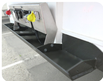
Soporte de conexões inox e topo dianteiro de proteção XLarge reforçado